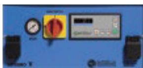
CONSOLE COMANDI CONTROL PANEL