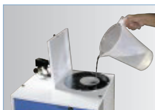
Vasca in plastica per Saturno/V ECO Plastic tank for Saturno/V ECO

STEAM GENERATOR WITH 2 IRONS AND MANUAL TANK